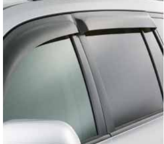
Tapis protecteurs toutes saisons