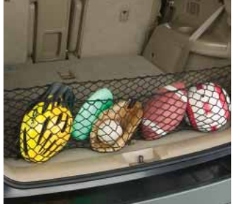
Filet de rétention

Système DVD/interface iPod MC de 10,2 po Système de navigation 6 Tapis protecteurs toutes saisons Démarrreur à distance Cendrier Porte-vélos pour porte-bagages de toit Rétroviseur intérieur à atténuation automatique avec boussole Porte-skis pour porte-bagages de toit Chauffe-bloc Radio satellite Doublure de compartiment de charge Barres-marchepieds latérales Filet de rétention Accessoires de remorquage Trousse d'assistance en cas d'urgence Tapis protecteurs de type « plateau » Trousse de premiers soins Défecteur de capot Protecteur de plaque d'immatriculation