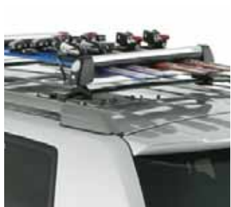
Porte-skis pour porte-bagages de toit