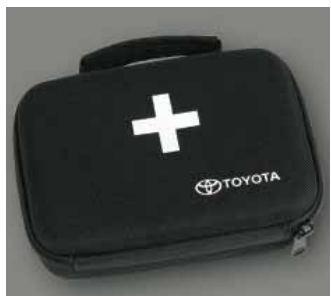
Trousse d'assistance en cas d'urgence