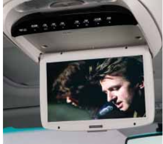
Système DVD/interface iPod MC de 10,2 po