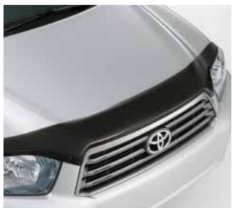
Défecteur de capot