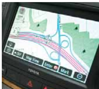
Système de navigation 6