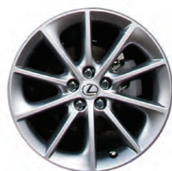
Roues de 17 po en alliage à 10 rayons EN OPTION