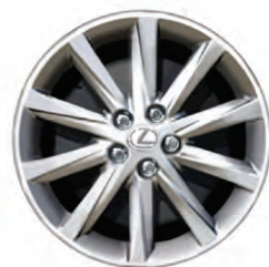
Roues de 16 po en alliage à 10 rayons DE SÉRIE