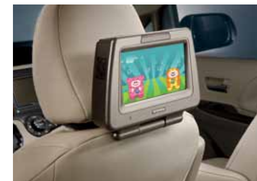
Système de divertissement à l'arrière Pour occuper et divertir les enfants pendant les longs trajets.