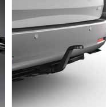
Accessoires de remorquage Transportez votre charge avec confiance grâce à un attelage de remorquage.