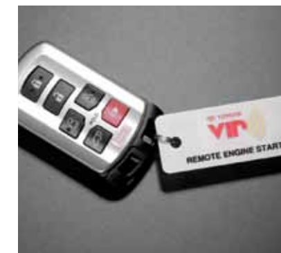
Démarreur à distance Démarrez votre véhicule jusqu'à 25 mètres (80 pi) de distance pour le refroidir ou le réchauffer avant de monter à bord.