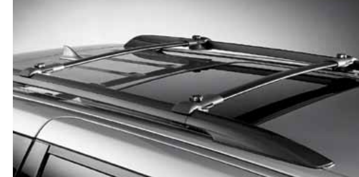
Barres transversales pour porte-bagages de toit