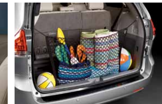
Filet de rétention