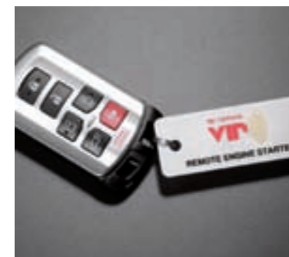
Démarreur à distance Démarrez votre véhicule jusqu'à 25 mètres (80 pi) de distance pour le refroidir ou le réchauffer avant de monter à bord.