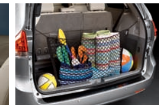
Filet de rétention