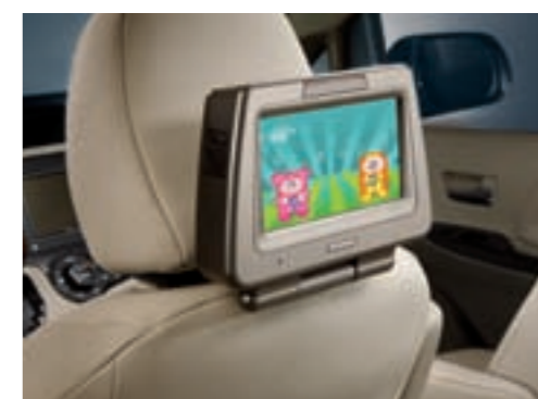
Système de divertissement à l'arrière Pour occuper et divertir les enfants pendant les longs trajets.