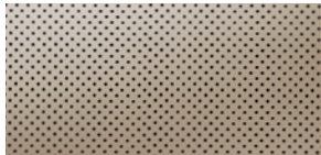
CUIR DE PREMIÈRE QUALITÉ - PERFORÉ