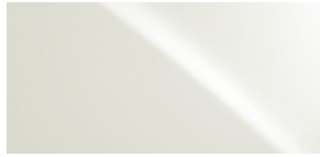
BLANC STELLAIRE NACRÉ 0077