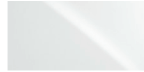
PLATINE LIQUIDE 01J2