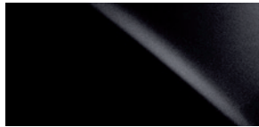
NOIR OBSIDIENNE 0212