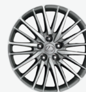
Roues de 19 po en alliage à 10 rayons divisés LS 460 F SPORT