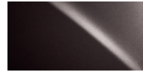
AGATE SOMBRE NACRÉ 04V3