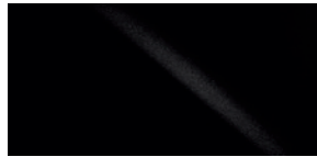
NOIR ZIRCON MICA 0217