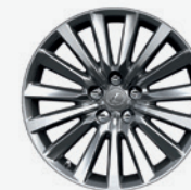
Roues de 19 po en alliage à multi rayons LS 460 de série