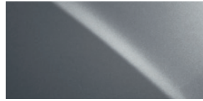
GRIS NÉBULEUX NACRÉ 01H9