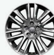
Roues de 19 po en alliage à 7 rayons divisés LS 460L de série LS 600h L de série